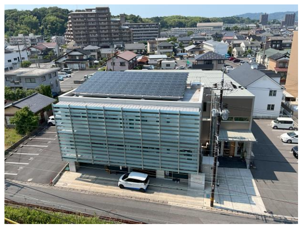
自社の建物の太陽光パネル